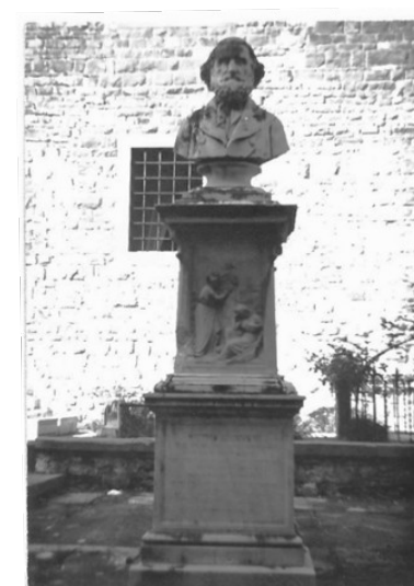
Monumento funebre di Pietro Giannone nel cimitero di San Miniato al Monte – Firenze